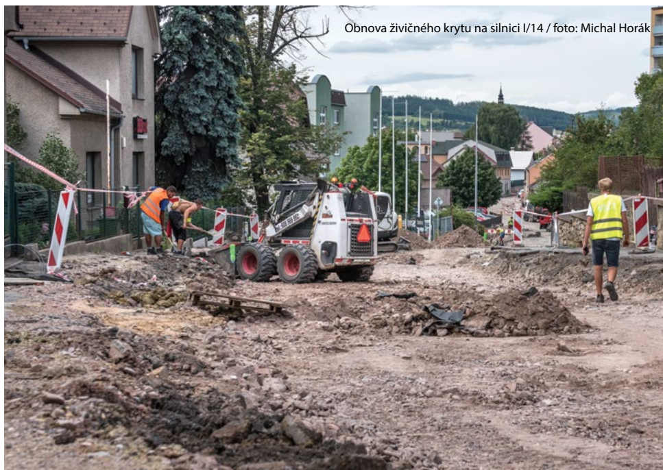
Obnova živičného krytu na silnici I/14