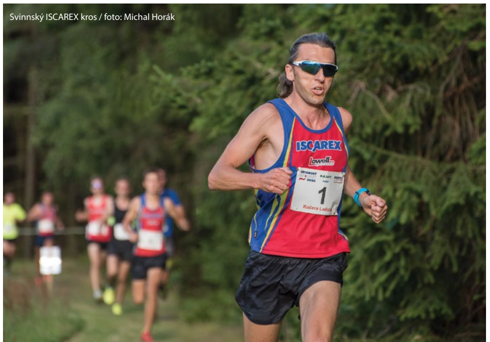
Svinnský ISCAREX kros

Hledáme nové talenty z řad dětí ve věku od 6 let, které se stanou součástí našeho týmu. Přijďte se podívat v měsíci září na trénink našich mladých nadějí do tělocvičny Na skále, každé úterý – 16:30 až 18:00 a čtvrtek 16:00 až 17:30, www.judoceskatrebova.cz Přijď mezi nás! Těšíme se na vás. Tým juda. Jan Kuzněcov 737 407 336 Martin Štusák 602 696 921