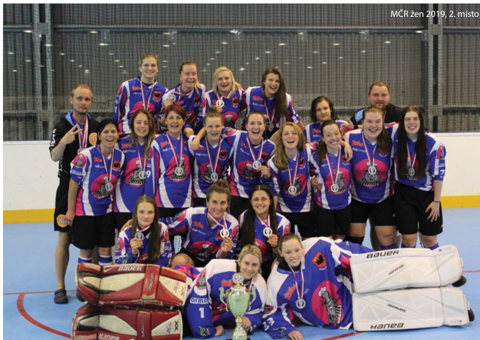
MČR žen 2019, 2. místo