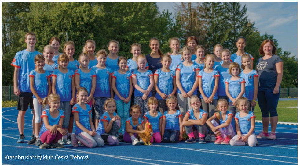
Krasobruslařský klub Česká Třebová