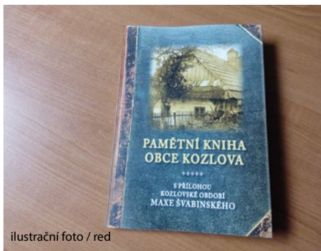
ilustrační foto / red