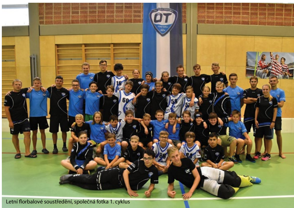
Letní florbalové soustředění, společná fotka 1. cyklus