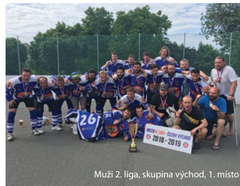
Muži 2. liga, skupina východ, 1. místo