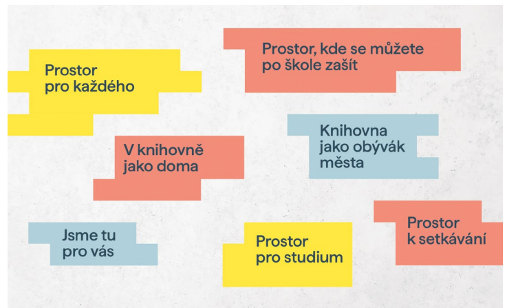
Tematické slogany v graficky znázorněném prostoru