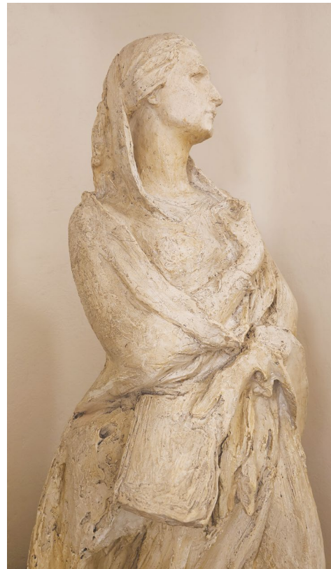
Karel Pokorný, návrh na pomník Boženy Němcové, Sbirka MMČT