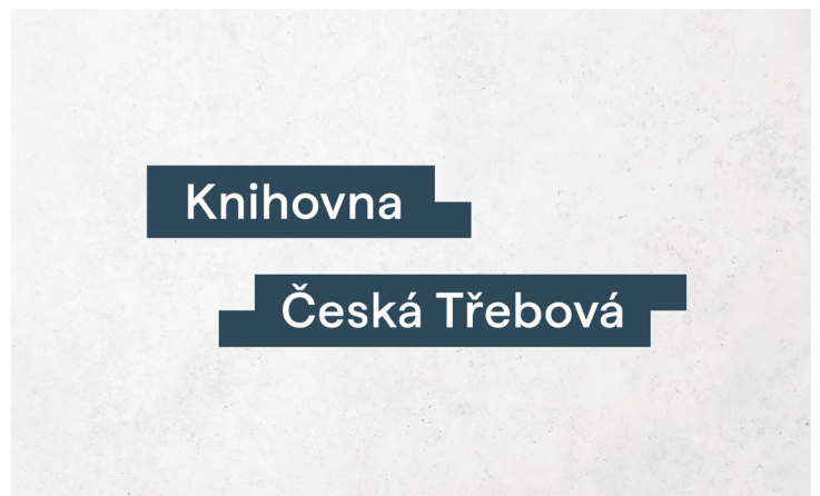
Nové logo knihovny