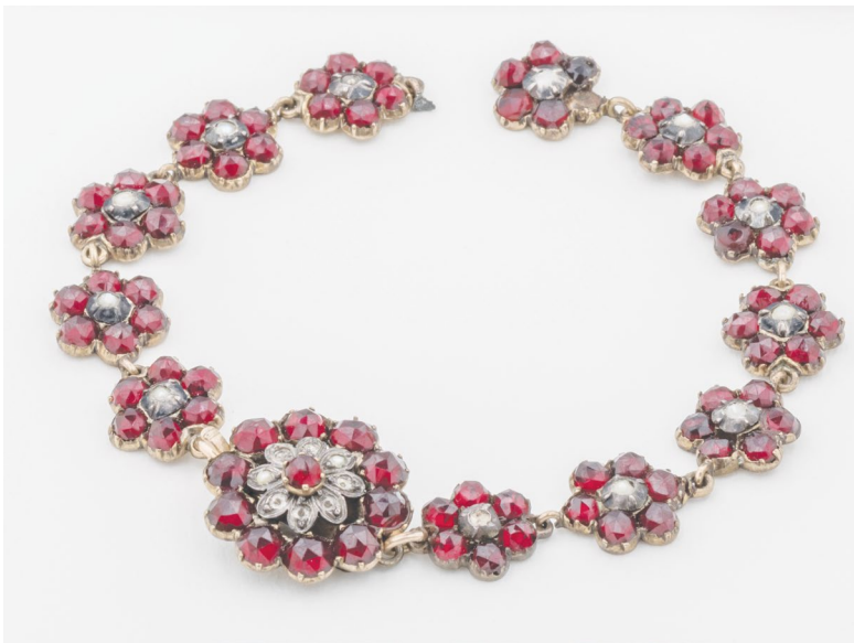
Granátový náramek Boženy Němcové, Sbirka Regionálního muzea v Litomyšli, inv. č. 9G-29.

„Jsem si dobře vědoma tak vzácné památky a protož nesmí zůstatí majetkem pouze mým, ale patří – celému národu.“