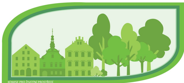
KOMISE PRO ŽIVOTNÍ PROSTŘEDÍ