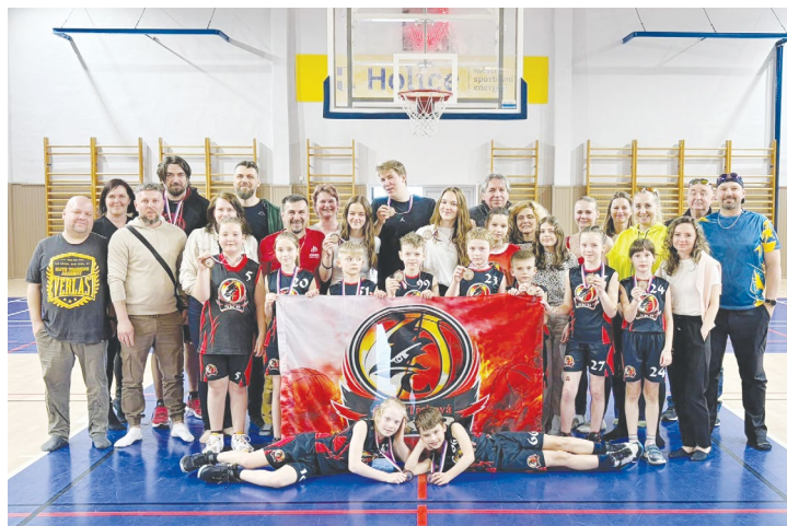
kategorie nejmladších minizáků U10