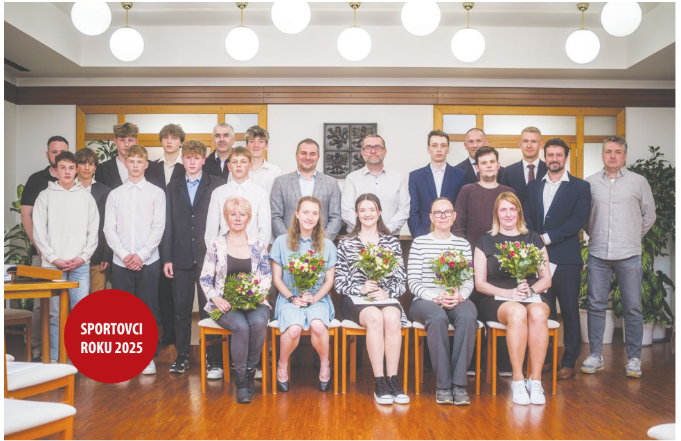
foto na titulní straně: FK Česká Třebová – starší žáci

Nejlepší tuzemský tenista ročníku 2010 již třetím rokem hraje za ČR ATK Agrofert Prostějov, kam přestoupil z místního oddílu TK Česká Třebová. V poslední době se účastní především zahraničních turnajů, kde dosahuje vynikajících výsledků a obdivuhodným tempem tak stoupá ve světovém žebříčku juniorů.