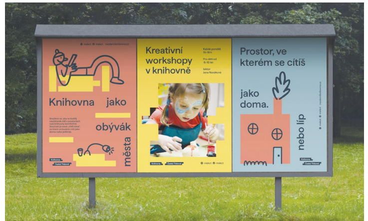
Ukázka užití vizuálního stylu na plakátech