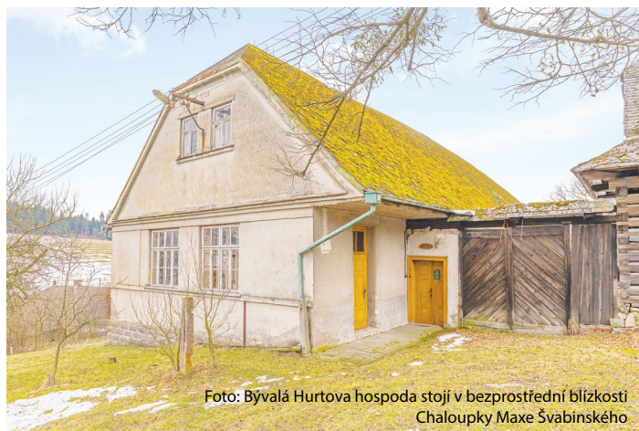
Foto: Bývalá Hurtova hospoda stojí v bezprostřední blízkosti Chaloupky Maxe Švabinského