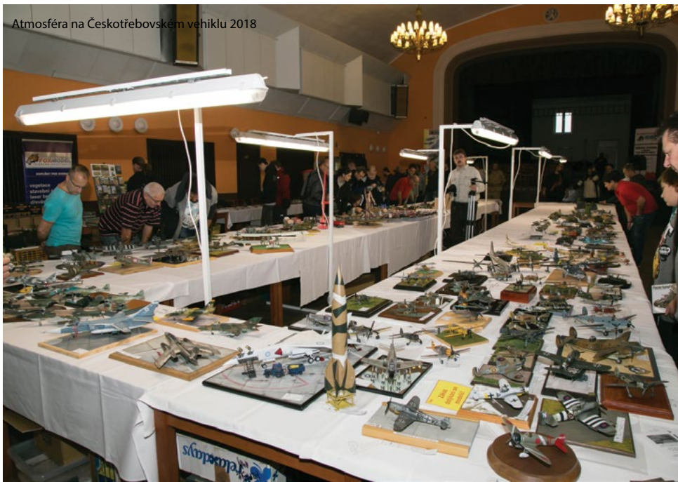
Atmosféra na Českotřebovském vehiklu 2018