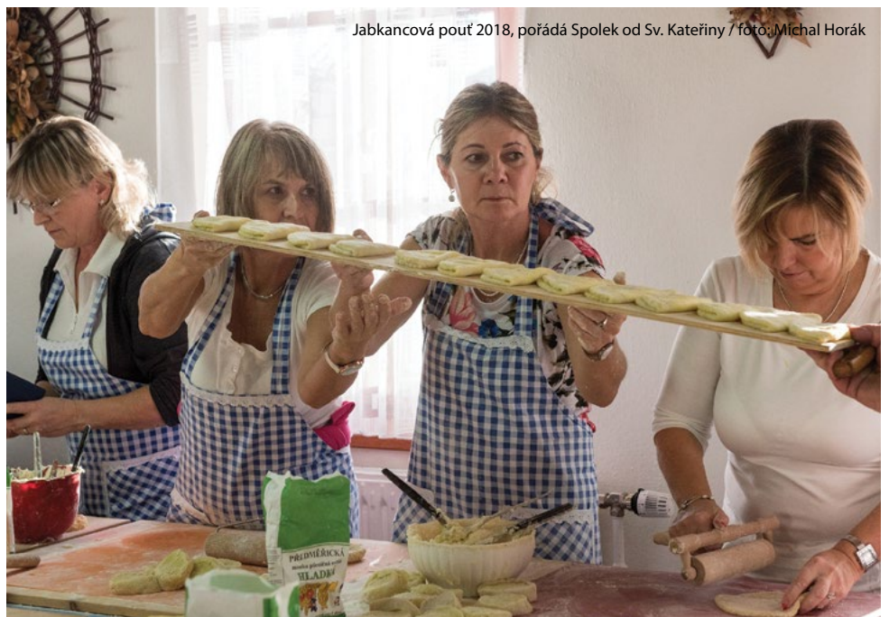
Jabkancová pouť 2018, pořádá Spolek od Sv. Kateřiny

Informace o akcích Městského muzea Česká Třebová naleznete i na webových stránkách muzea www.mmct.cz a na facebooku https://www.facebook.com/mmctcz .