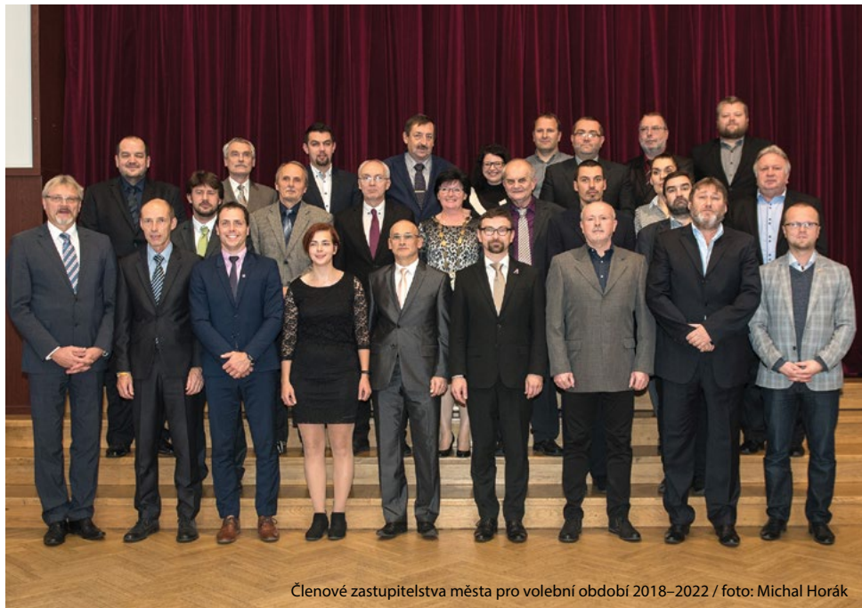
Členové zastupitelstva města pro volební období 2018–2022