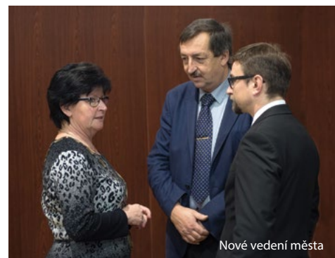
Nové vedení města

„ Doufám, že toto zastupitelstvo v novém složení bude takovým orgánem obce, za kterým rovněž budou po čtyřech letech vidět výsledky práce. Svým spoluobčanům chci říct, že