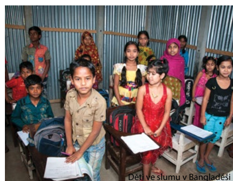
Děti ve slumu v Bangladéši