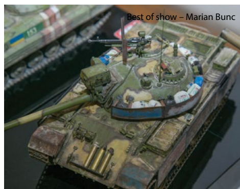
Vítek Vrog Přívratský, ředitel soutěže

Z pohledu organizátora se akce opravdu podařila. Snad mi odpustíte, že závěrem poděkuji všem, kteří soutěž podpořili, ať již finančně, nebo přiložili ruku k dílu.