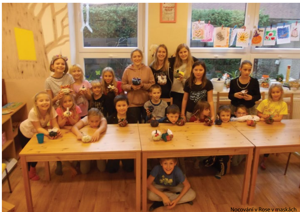
Nocování v Rose v maskách