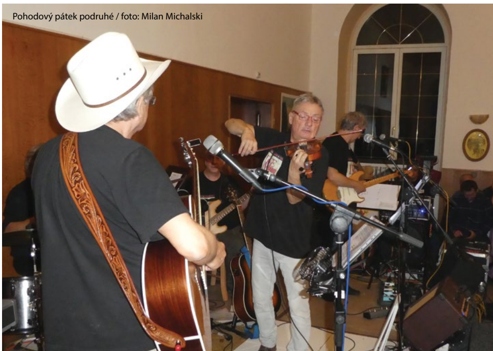
Pohodový pátek podruhé