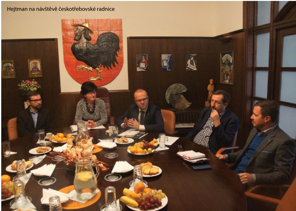
Hejtman na návštěvě českotřebovské radnice