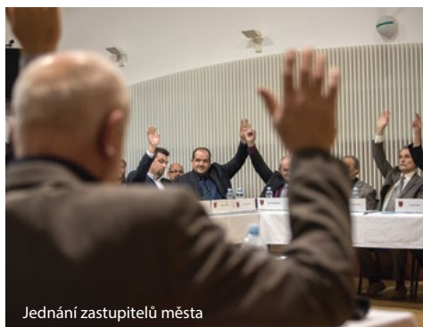
Jednání zastupitelů města