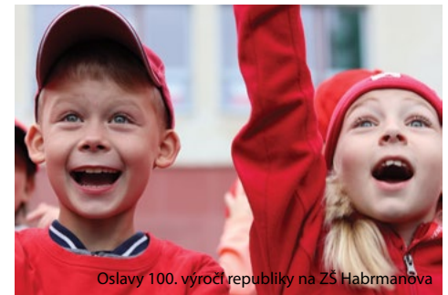
Oslavy 100. výročí republiky na ZŠ Habrmanova