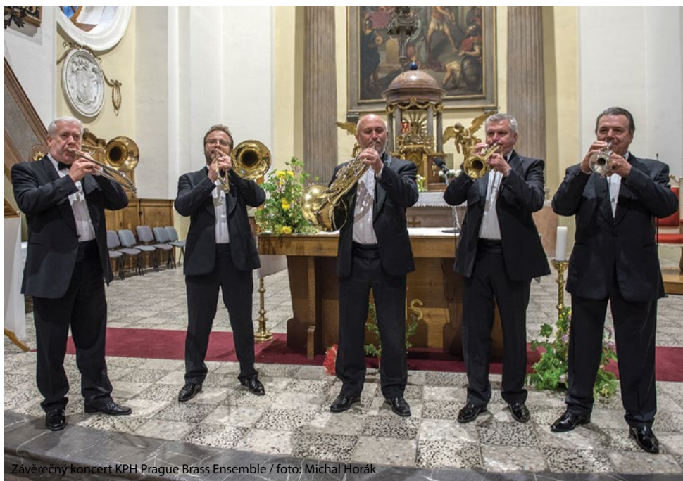
Závěrečný koncert KPH Prague Brass Ensemble