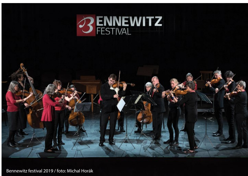
Bennewitz festival 2019

Markéta Drmotová, Oblastní charita Ústí nad Orlicí