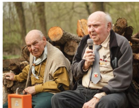
Junák – český skaut, středisko Javor Česká Třebová, z. s. www.javorct.cz

Vernisáž výstavy Nástup! 100 let skautingu v České Třebové se uskuteční v městském muzeu 13. června od 17 hodin. Výstava potrvá do 1. září.