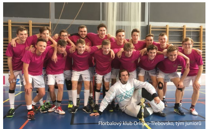
Florbalový klub Orlicko-Třebovsko, tým juniorů