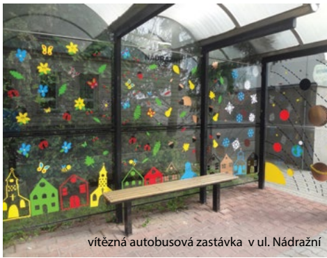
vítězná autobusová zastávka v ul. Nádražní