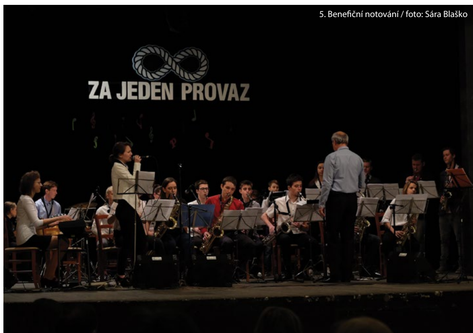
5. Benefiční notování