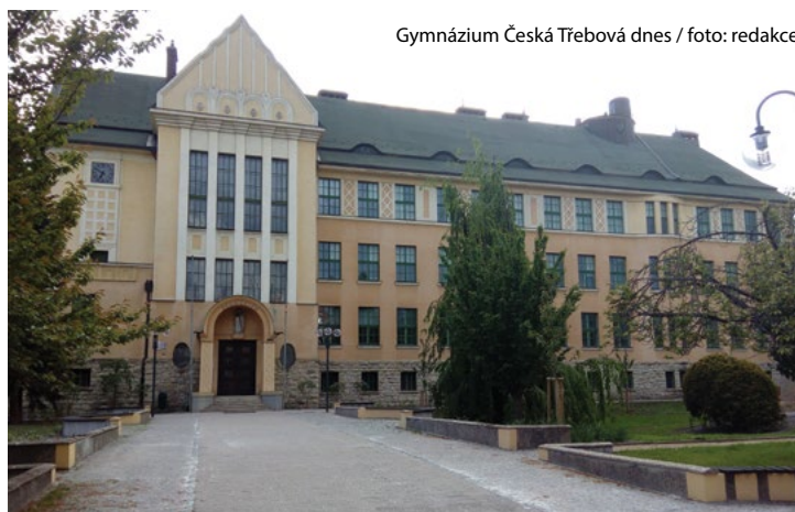
Gymnázium Česká Třebová dnes / foto: redakce