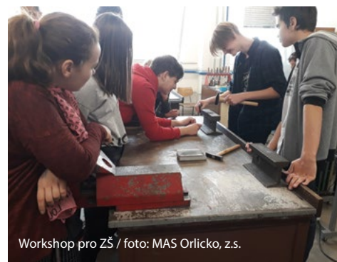
Workshop pro ZŠ