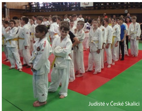
Judisté v České Skalici