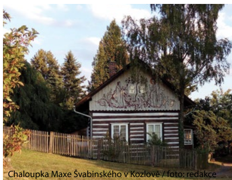
Chaloupka Maxe Švabinského v Kozlově