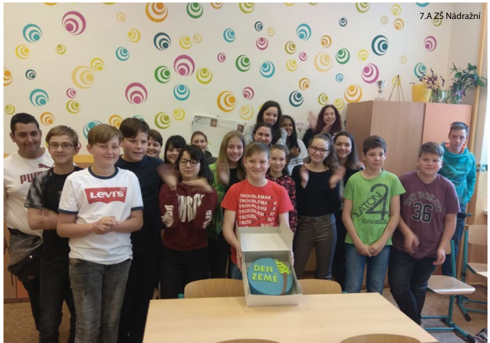
7.A ZŠ Nádražní