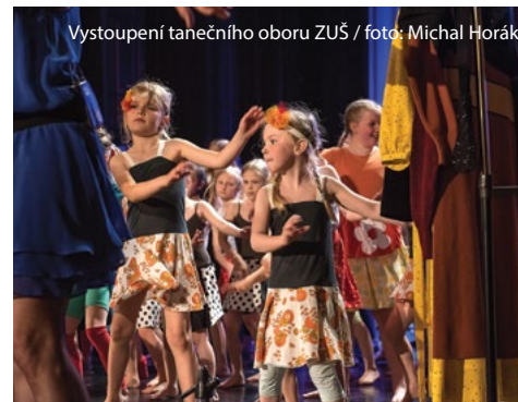
Vystoupení tanečního oboru ZUŠ