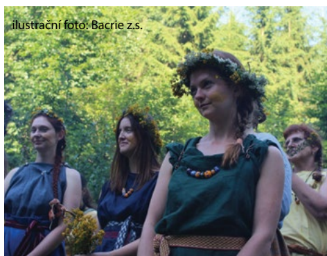
ilustrační foto: Bacrie z.s.