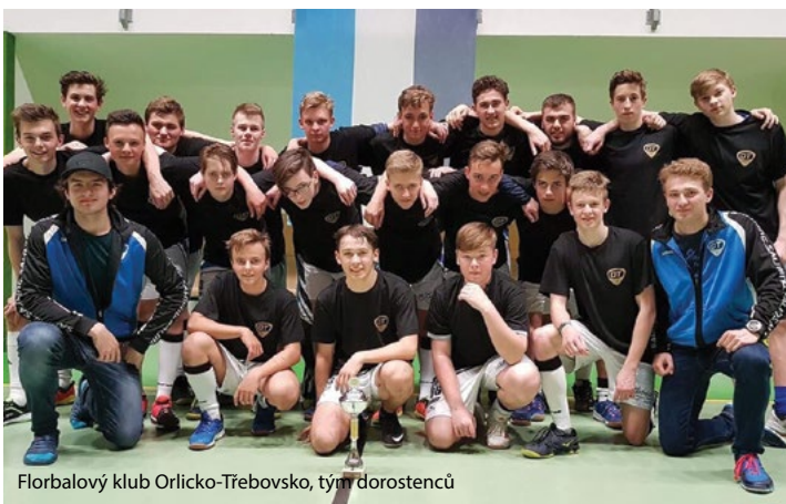
Florbalový klub Orlicko-Třebovsko, tým dorostenců