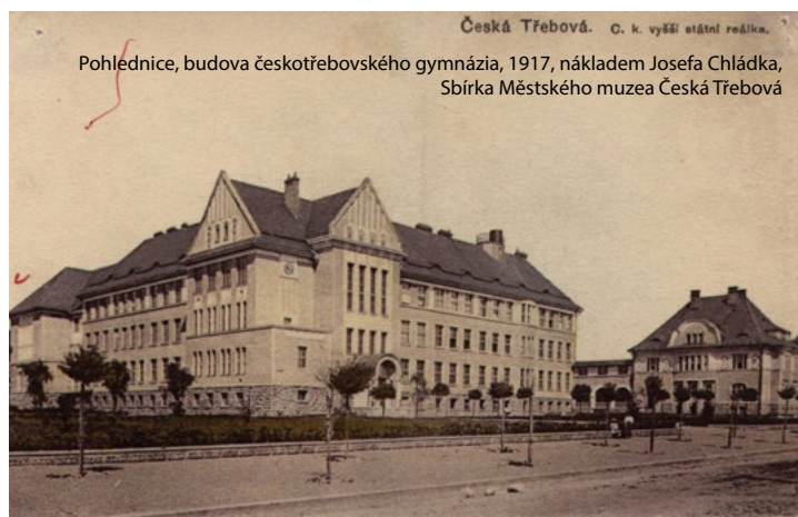
Česká Třebová. C. k. vyšší státní reálka. Pohlednice, budova českotřebovského gymnázia, 1917, nákladem Josefa Chládky, Sbírka Městského muzea Česká Třebová