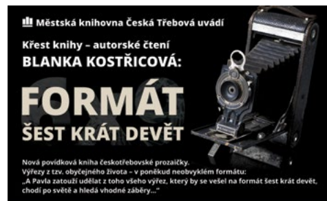
Pondělí 8. dubna 2019 v 19 hodin, Městská knihovna, 1. patro

Křest knihy se koná v pondělí 8. dubna v 19 hodin v Městské knihovně (1. patro).