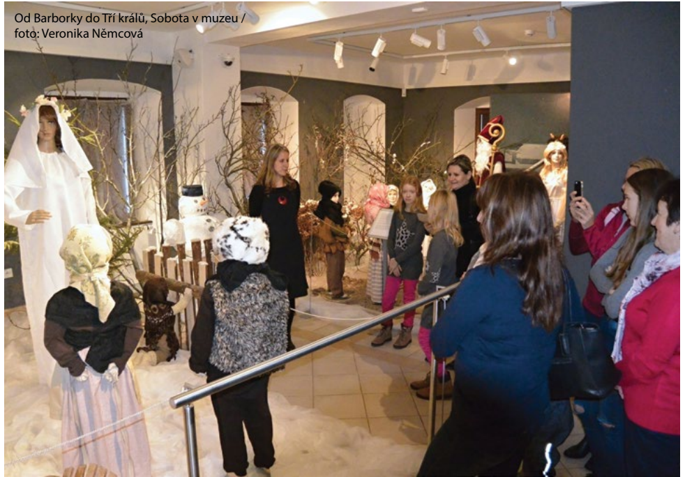
Od Barborky do Tří králů, Sobota v muzeu

Tradiční vánoční výstava Od Barborky do Tří králů návštěvníkům přibližuje některé zvyky a postavy adventního a vánočního času. Výstava potrvá do neděle 6. ledna 2019.