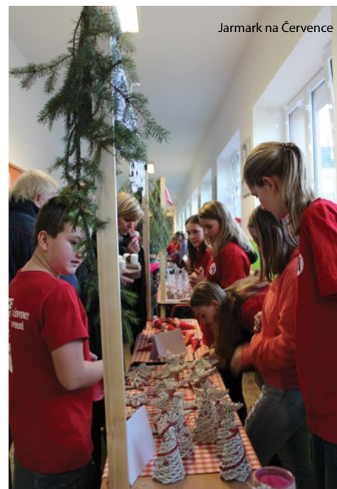
Jarmark na Července