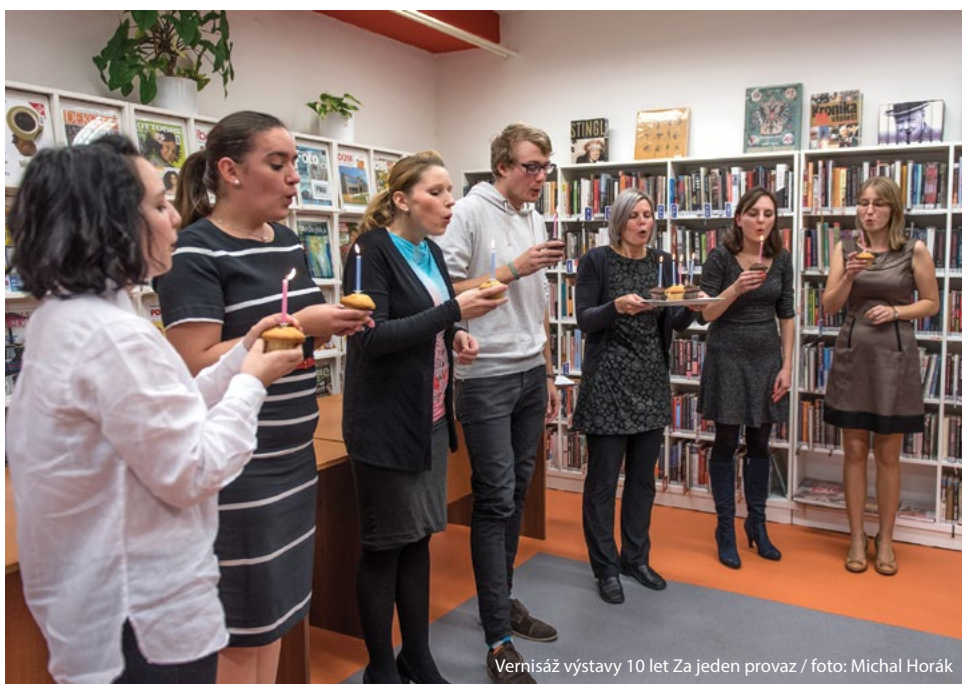
Vernisáž výstavy 10 let Za jeden provaz

Další informace a aktuální otevírací dobu naleznete na webové stránce https://moderniknihovna.cz/cs/ nebo https://www.facebook.com/mekct/ . Psát můžete na info@moderniknihovna.cz nebo volejte 732 756 827.