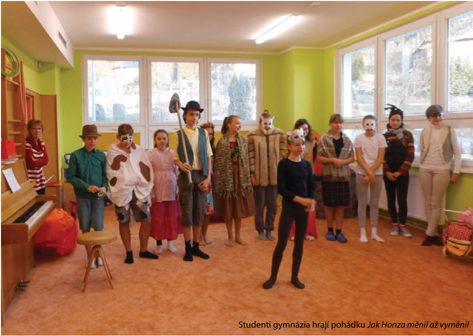
Studenti gymnázia hrají pohádku Jak Honza měnil až vyměnil