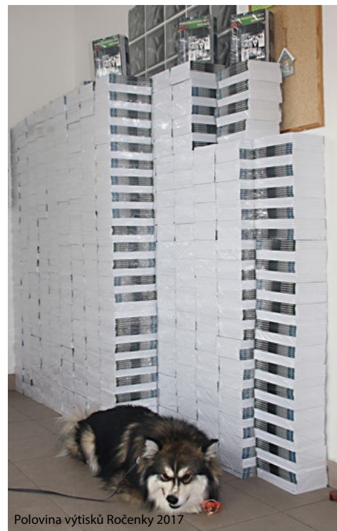
Polovina výtisků Ročenky 2017

Studenti i učitelé gymnázia již řadu let v tomto programu podporují 2 indické děti a platí jim školné. Po dopolední besedě se studenty představí P. Suchár projekt Adopce na dálku i česko-třebovské veřejnosti, a to od 17:00 hodin v budově Gymnázia. Přednáška se bude zabývat podstatou a fungováním charitativní pomoci indickým