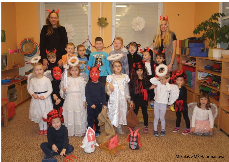
Mikuláš v MŠ Habrmanova

Děti a učitelky MŠ Vinohrady, třída Včeliček