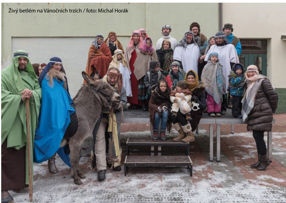
Živý betlém na Vánočních trzích