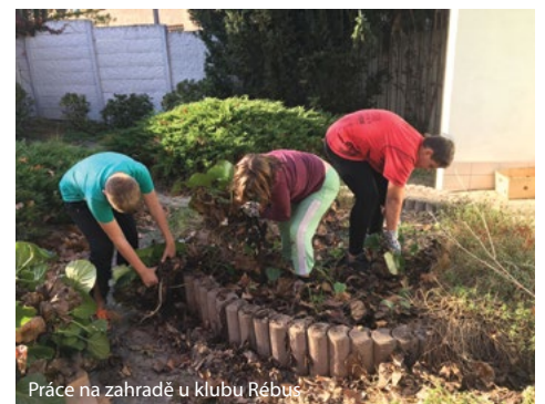
Práce na zahradě u klubu Rébus