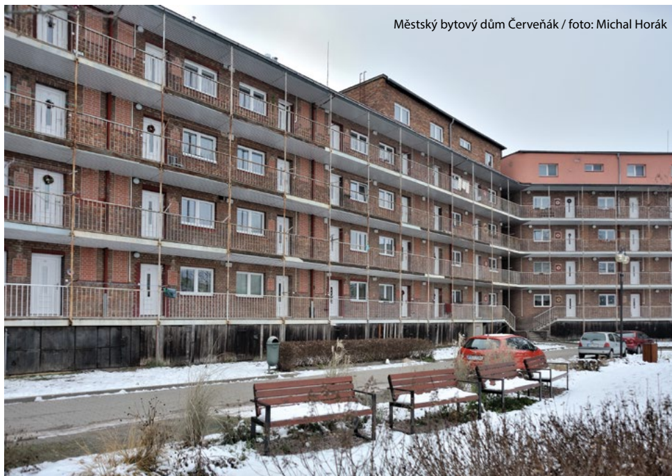
Městský bytový dům Červeňák

Hana Sychrová, redaktorka Českotřebovských novin