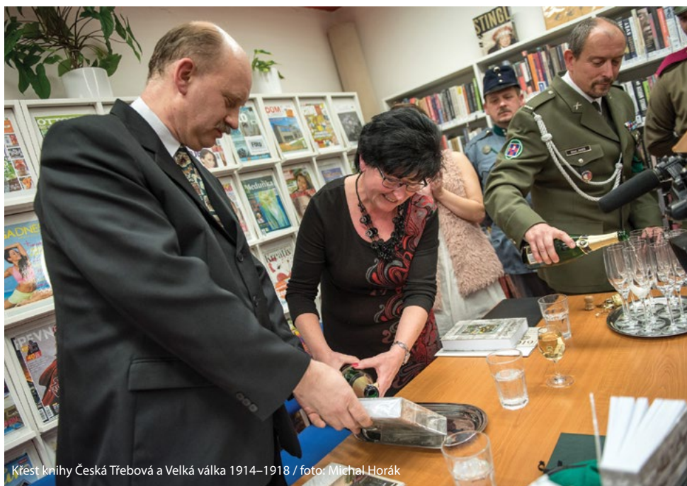
Křest knihy Česká Třebová a Velká válka 1914–1918

Z rozhovor děkuje redaktorka Hana Sychrová.