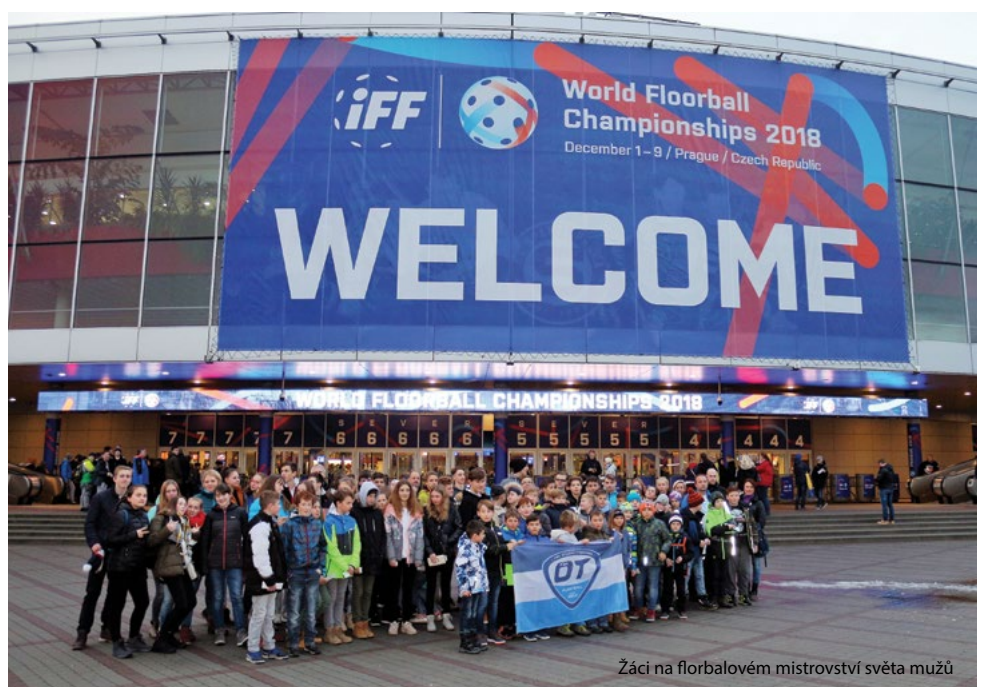
Žáci na florbalovém mistrovství světa mužů