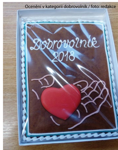
Ocenění v kategorii dobrovolník

Na 8. ledna připravujeme členskou schůzi, kde se domluvíme, kam napneme síly v roce 2019. Nějaké nové nápady už máme, ale určitě budeme dál pracovat na našich dvou naučných stezkách. Letos jsme hodně opravovali cedule a samotnou stezku Údolím Skuhrovského potoka. Teď sháníme finance na opravu knajpoviště v Semanínské naučné stezce, která už funguje osm let a chtěli