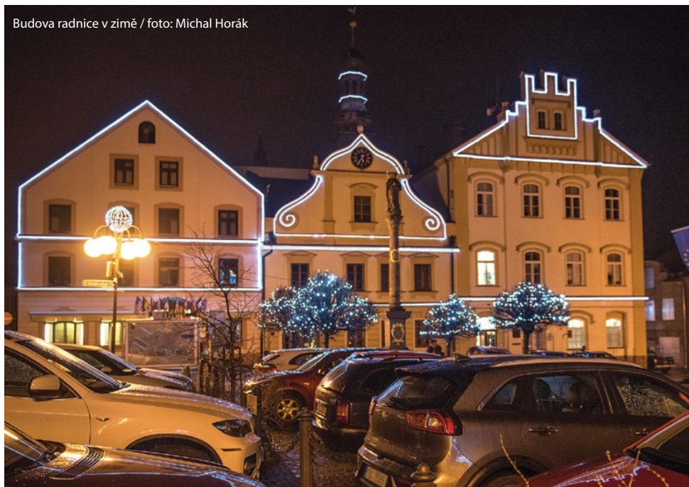
Budova radnice v zimě