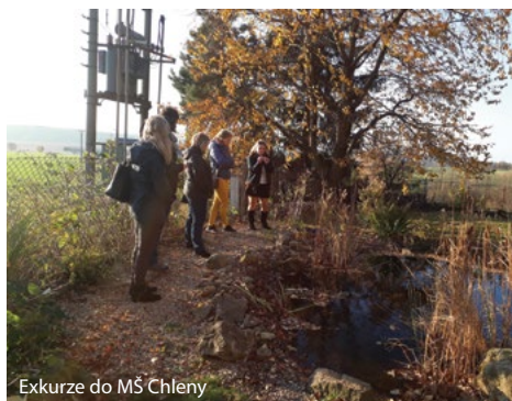
Exkurze do MŠ Chleny