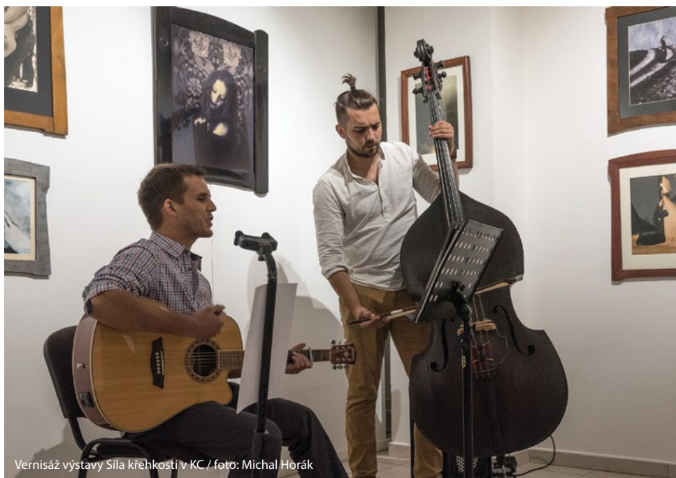
Vernisáž výstavy Síla křehkosti v KC