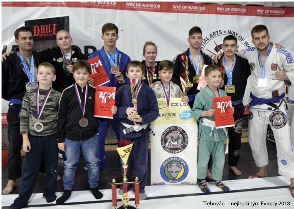
Třebováci – nejlepší tým Evropy 2018