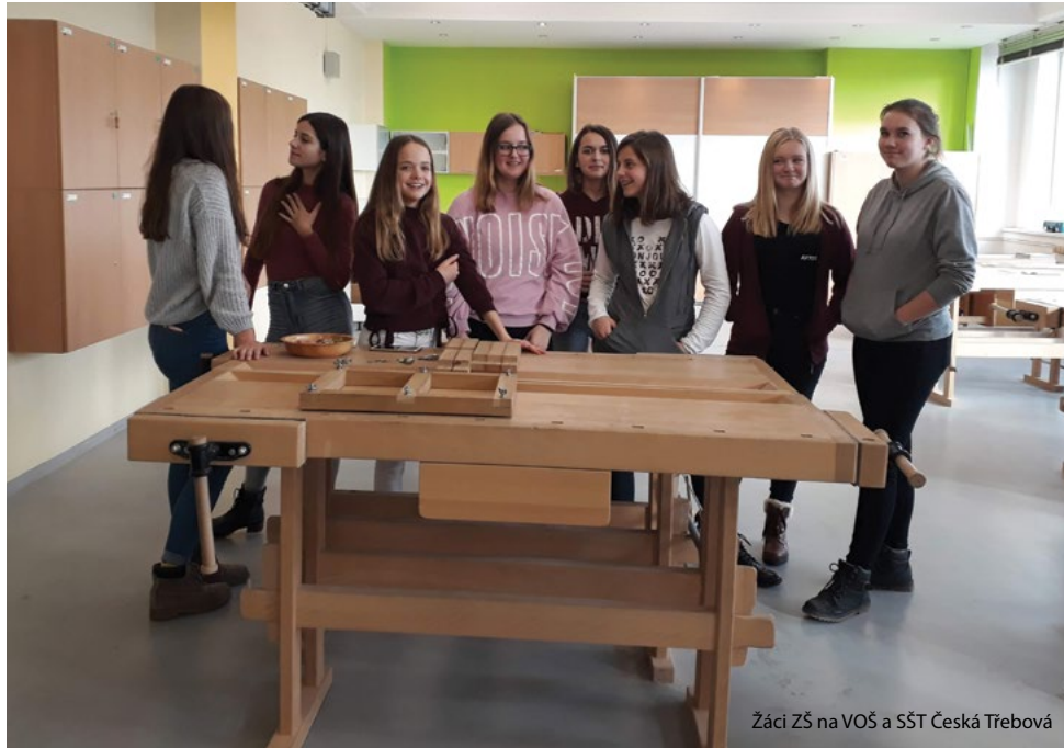
Žáci ZŠ na VOŠ a SŠT Česká Třebová

Doprava pro Vás jezdí každý pracovní den od 7:00 do 15:30 hodin . Cenu přepravy a podmínek využití zjistíte na http://www.cckuo.cz/doprava.htm nebo na telefonním čísle pro objednání.