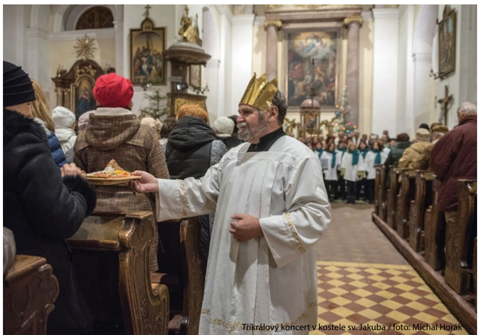
Tříkrálový koncert v kostele sv. Jakuba

Tel.: 773 601 427, e-mail: rcrosact@seznam.cz