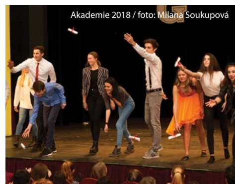
Akademie 2018

V pátek 14. června proběhne velmi zajímavá beseda se dvěma našimi známými absolventy, s hejtnem Pardubického kraje Martinem