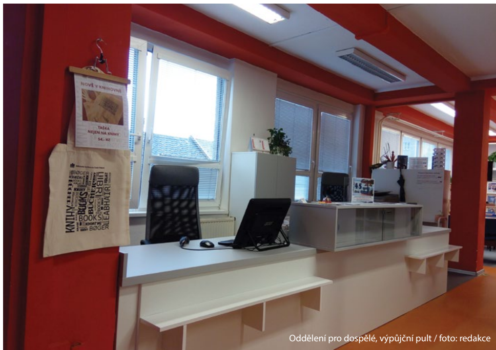
Oddělení pro dospělé, výpůjční pult