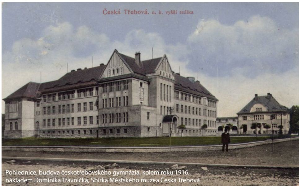
Pohlednice, budova českotřebovského gymnázia, kolem roku 1916, nákladem Dominika Trávníčka

Při tom všem však samozřejmě nesmíme zapomenout na studium. Je velmi důležité, abychom řádně stihli odučit vše, co se má. Naším základním úkolem je připravit studenty nejen k maturitě, ale také k přijímacím zkouškám na vysokou školu i k dalšímu studiu.