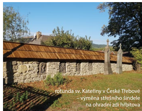
rotunda sv. Kateřiny v České Třebové – výměna střešního šindele na ohradní zdi hřbitova

Přehled hlavních finančních prostředků vynaložených z rozpočtu Města Česká Třebová na obnovu (restaurování) kulturních památek a objektů památkového charakteru v MPZ a ORP Česká Třebová a informace o příspěvcích z dotačních programů ministerstva kultury a zemědělství a Pardubického kraje v roce 2018