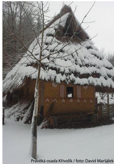
Pravěká osada Křivolík