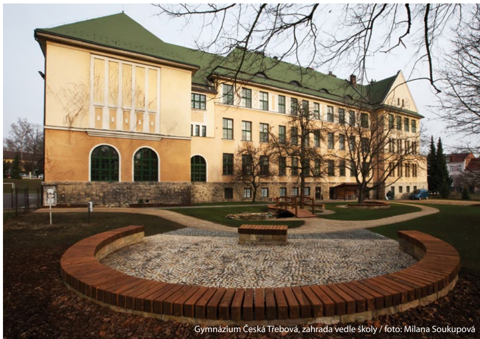
Gymnázium Česká Třebová, zahrada vedle školy