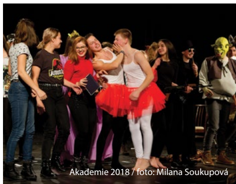
Akademie 2018

modernizaci vybavení. Do budoucna bychom potřebovali novou chemickou laboratoř i zrekonstruovanou tělocvičnu, ale to je nikdy nekončící proces obnovy, se kterým si, věřím, budete umět poradit. Zásadnější otázkou pro mě zůstává, jakým způsobem v budoucnu co nejlépe doplnit pedagogický sbor v okamžiku, kdy odejde početná generace učitelů, kterým je dnes přes padesát let. Dále také přemýšlím o tom, co vlastně znamená pojem kvalitní vzdělání. Je to více slovíček, definic, více vzorečků? Jistě ne, domnívám se, že je to mimo jiné schopnost umět si vybrat ze všech informací ty zásadní a důležité, dovednost rozumně se zorientovat v komplikovaném světě kolem nás. Na našem gymnáziu jsem studoval a maturoval, po vojenské službě dvacet let učil a nyní sedmým rokem vykonávám funkci ředitele. Mohu tedy snad říci, že školu znám. Gymnázium mělo vždy svou zvláštní atmosféru. Ta pramenila mimo jiné z toho, že se zde potkávali, přátelili a také navzájem ovlivňovali lidé napříč třídami bez ohledu na ročník narození, věděli o sobě, fandili si i mimo školu. To bychom rádi zachovali. Taková okolnost se nedá nařídít, změřit, vypočítat. Je to pocit, který prostě buď na vlastní kůži zažijete, nebo ne.